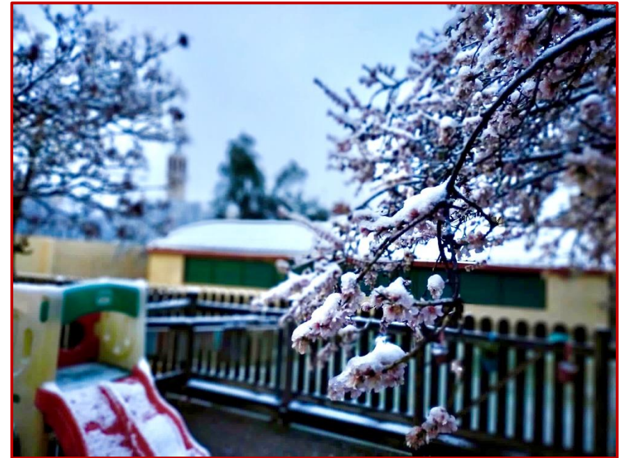
Fotografia de la nevada del dia 27 de febrer.

Com cada any us demanem si voleu ajudar-nos a decorar aquest butlletí.