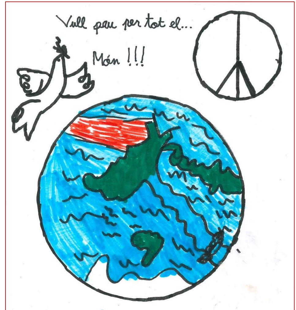
Dibuix de la Iveta Salvador Monzón, de 3r: "L'ANY 2021 VULL PAU PER A TOT EL MÓN!"